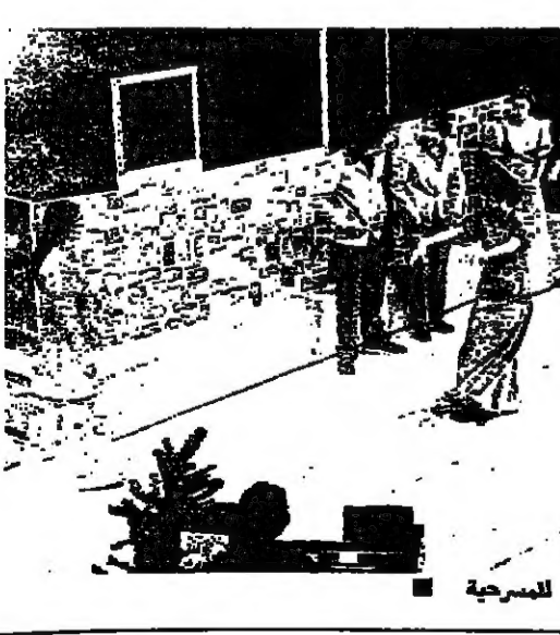
مشهد عام للمسرحية

«اغنية الميلاد» المسرحية الشهيرة للكاتب تشارلز ديكرز قدمت امس على مسرح قلوبنيكان في كلية بيروت الجامعية وحضرها عيد الكلية الدكتور رياض نصار ونائبة رئيس الكلية الدكتورة مساري صبري وحشد كبير من طالبات وطلاب الكلية.